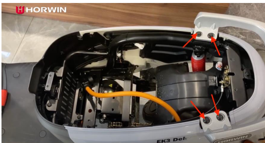
Obrázek 2: 4 šrouby upevňující hliníkové madlo