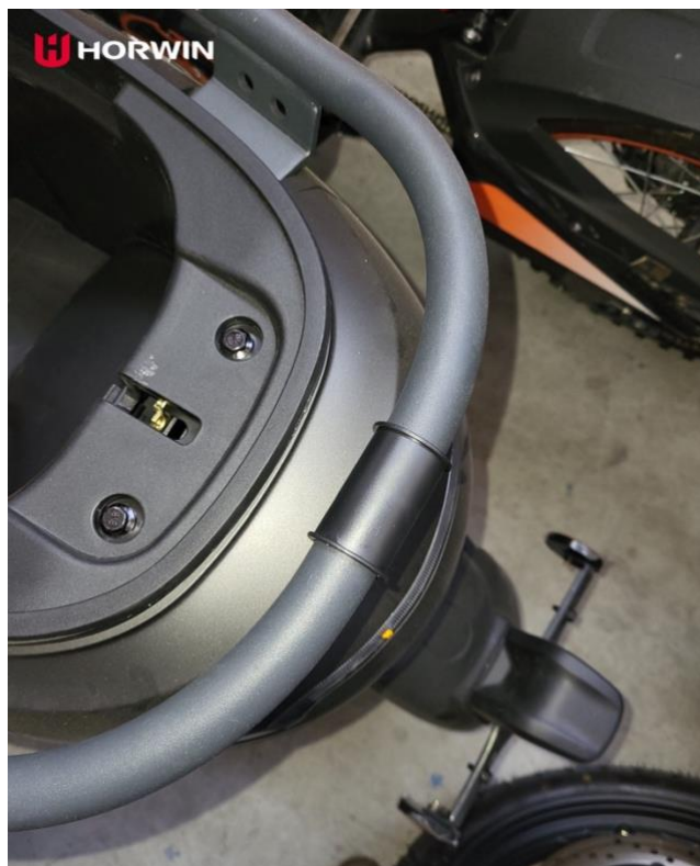
Obrázek 4: Gumová ochrana trubkového madla