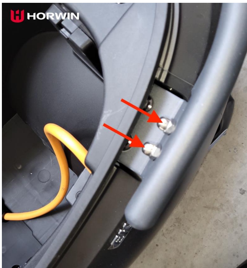
Obrázek 8: Šrouby k upevnění nosiče k trubkovému madlu

7) Pomocí čtyř šroubů upevněte nosič k trubkovému madlu (Obrázek 8)