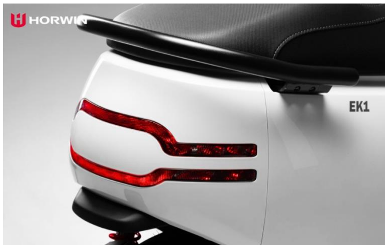
Obrázek 3: Trubkové madlo